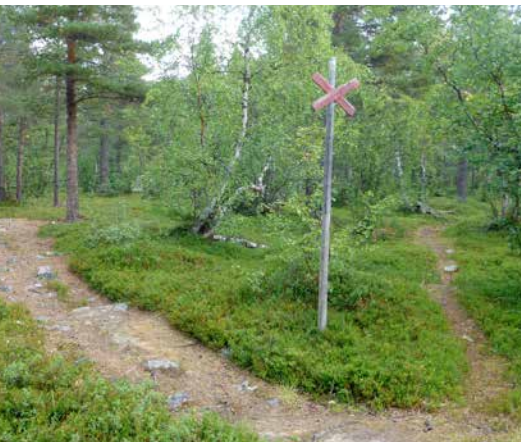
Vad är det här för stigar? Vart leder de och vilken historia har de? Rörelsearv som dessa saknar ofta historisk kontextualisering och för såväl besökare som lokalbefolkning kan det vara svårt att skilja en stig från en annan. Stigarna riskerar att reduceras till transportsträckor mellan sevärdheter.