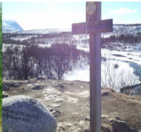
Meditationsplats längs Dag Hammarskjöldsleden, Abisko. På stenen finns ett citat från Hammarskjölds "Vägmärken", skrivet på svenska och samiska.

– Många av oss som verkar på fjället idag kan relatera till begreppet rörelsearv. Det har vi märkt i vår forskning när vi varit ute på fältstudier och vandringar, där vi fört samtal och hållit intervjuer med människor från olika intressegrupper, berättar hon.